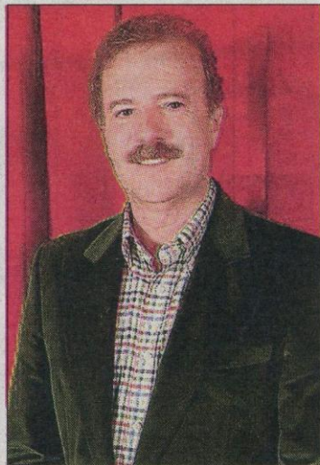
Manuel Campo Vidal en Valencia. SD

En la última conferencia, cuatrocientas personas colmaron la sala del SH Valencia Palace durante la presentación del estudio de Impacto económico de la llegada del AVE a Valencia protagonizada por el ministro José Blanco.